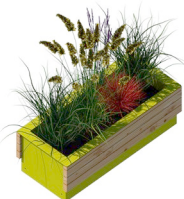
Pflanzkasten Anzahl / 3