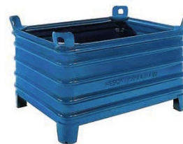
Baum-Pflanzkasten Anzahl / 4