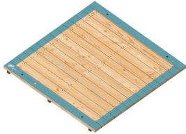
Podest Anzahl / 5