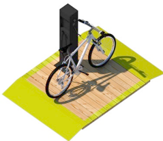
Radstelle Anzahl / 1