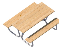
Picknick-Garnitur Anzahl / 2 *nur in Kombination mit Podest möglich