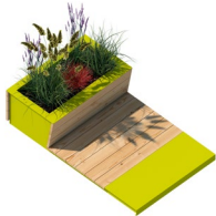
Parklet-Pflanzmodul Anzahl / 3

Bitte kontaktieren Sie im Vorfeld ihrer Bewerbung ihre Ansprechpartnerin/ihren Ansprechpartner.