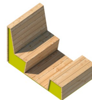
Parklet-Sitzmodul Anzahl / 3