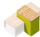
Tisch Anzahl / 2 *nur in Kombination mit Bank möglich