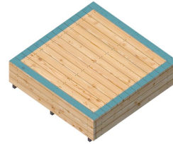
Bühne Anzahl / 1