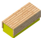
Bank Anzahl / 3