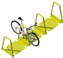
Radständer groß Anzahl / 1