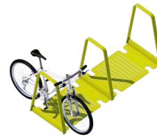
Radständer klein Anzahl / 1